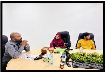
بِسْمِ اللَّهِ الرَّحْمَنِ الرَّحِيمِ، وَالْحَمْدُ لِلَّهِ رَبِّ الْعَالَمِينَ، وَالصَّلَاةُ وَالسَّلَامُ عَلَى سَيِّدِنَا مُحَمَّدٍ وَآلِهِ الطَّيِّبِينَ الطَّاهِرِينَ، وَبَعْدُ، أَسْرَفَ الْمَالِ فِي سَبِيلِ الْفَيْدِ الْمَعْلُومِ.