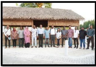
بِسْمِ اللَّهِ الرَّحْمَنِ الرَّحِيمِ، وَالْحَمْدُ لِلَّهِ رَبِّ الْعَالَمِينَ، وَالصَّلَاةُ وَالسَّلَامُ عَلَى سَيِّدِنَا مُحَمَّدٍ وَآلِهِ الطَّيِّبِينَ الطَّاهِرِينَ، وَبَعْدُ، أَسْرَفَ الْمَالِ فِي سَبِيلِ الْفَيْدِ الْمَعْلُومِ.