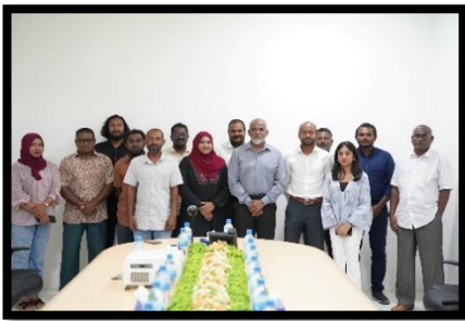
بِسْمِ اللَّهِ الرَّحْمَنِ الرَّحِيمِ، وَالْحَمْدُ لِلَّهِ رَبِّ الْعَالَمِينَ، وَالصَّلَاةُ وَالسَّلَامُ عَلَى سَيِّدِنَا مُحَمَّدٍ وَآلِهِ الطَّيِّبِينَ الطَّاهِرِينَ، وَبَعْدُ، أَسْرَفَ الْمَالِ فِي سَبِيلِ الْفَيْدِ الْمَعْلُومِ.