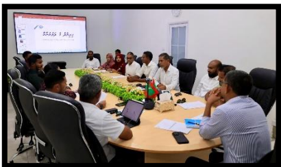
بِسْمِ اللَّهِ الرَّحْمَنِ الرَّحِيمِ، وَالْحَمْدُ لِلَّهِ رَبِّ الْعَالَمِينَ، وَالصَّلَاةُ وَالسَّلَامُ عَلَى سَيِّدِنَا مُحَمَّدٍ وَآلِهِ الطَّيِّبِينَ الطَّاهِرِينَ، وَبَعْدُ، أَسْرَفَ الْمَالِ فِي سَبِيلِ الْفَيْدِ الْمَعْلُومِ.